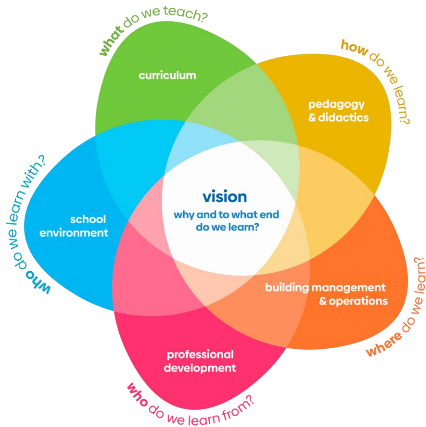
Figura 3: Qasja e të gjithë shkollës ndaj zhvillimit të qëndrueshëm 11

dhe profesionistë të përgjegjshëm, me mendime progresive në një botë që ndryshon me shpejtësi.