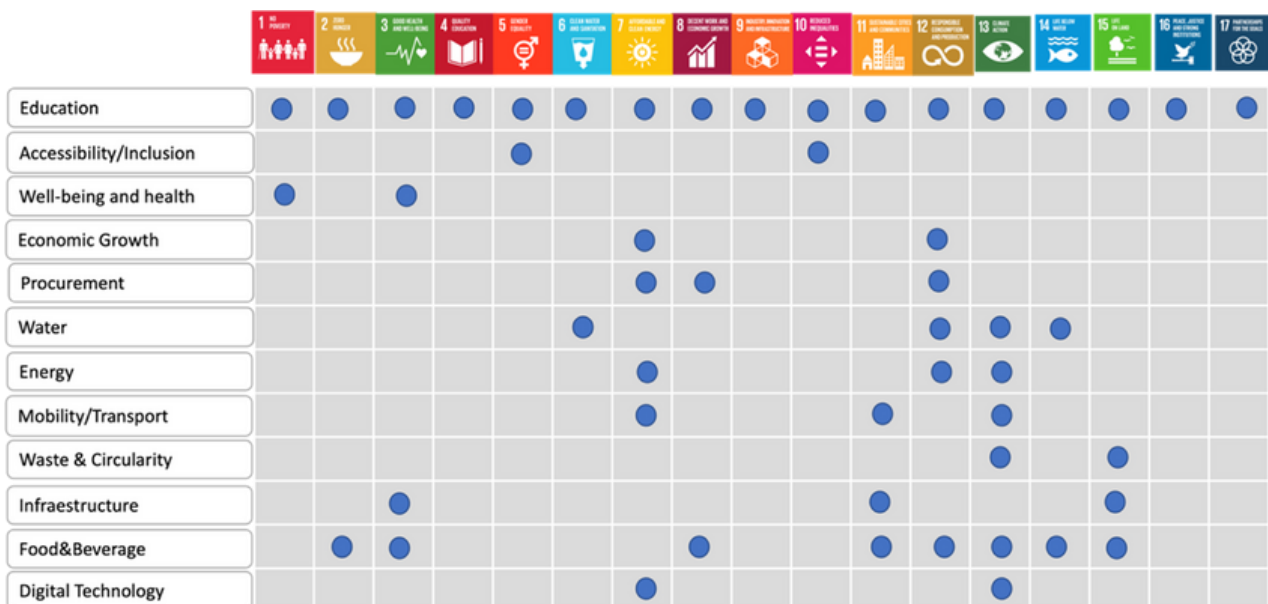
Figura 1: Kontributi i mundshëm i AFP-së në Objektivat e Zhvillimit të Qëndrueshëm (SDGs)

Udhëzimet D3.2 për krijimin e planeve të veprimit për institutet e AFP-së janë konceptuar si një fener për institutet e AFP-së që lundrojnë në këtë epokë transformuese. Këto udhëzime i pajisin institutet me njohuri, mjete dhe korniza për të hartuar dhe zbatuar plane veprimi gjithëpërfshirëse. Plane të tilla jo vetëm që do të përputhen me objektivat strategjikë të Marrëveshjes së Gjelbër Evropiane, por gjithashtu do të fuqizojnë nxënësit e AFP-së për t'u bërë pararoja e një të ardhmeje të qëndrueshme. Kjo hyrje shtron bazën për kapitujt pasues, të cilët do të thellohen në specifikat e zhvillimit të planit të veprimit.